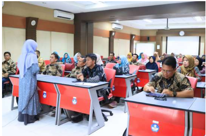
Dok. Warta GuruCalakan

“Pojok Belajar Komunitas ini hadir untuk menjawab tingginya permintaan peningkatan kompetensi dari komunitas belajar di berbagai daerah, tidak hanya di Jawa Barat.”