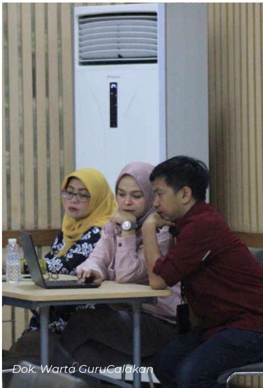
Dok. Warta GuruCalakan

BBGP Jabar tidak pernah berhenti berinovasi untuk memberikan layanan terbaik bagi guru dan tenaga kependidikan di Jawa Barat.