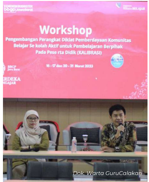
Dok. Warta GuruCalakan

Melalui tim kerja Inovasi Pembelajaran, BBGP Jabar menyelenggarakan Diklat Pemberdayaan Komunitas Belajar Sekolah Aktif Untuk Pembelajaran Berpihak Pada Peserta Didik (KALIBRASI) Angkatan 1-5 dengan total peserta 377 guru yang berasal dari sekolah di wilayah Jabar.