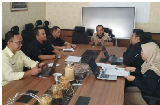
Dok. Warta GuruCalakan

Angka Kredit merupakan suatu nilai kuantitatif dari hasil kerja pejabat fungsional.