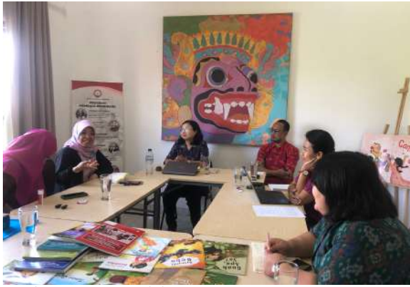
Dok. Warta GuruCalakan

mengelompokkan siswa pada tingkat membaca yang sesuai serta memantau kemajuan membaca mereka. Siswa memiliki kesempatan untuk menerapkan dan mengkonsolidasikan keterampilan dan strategi membaca yang disajikan dalam pelajaran interaktif dan bersama. Sedangkan guru memantau siswa untuk akurasi, pengetahuan kata, dan pemahaman. Pada tahap ini, korelasi langsung antara membaca dan menulis juga ditekankan.