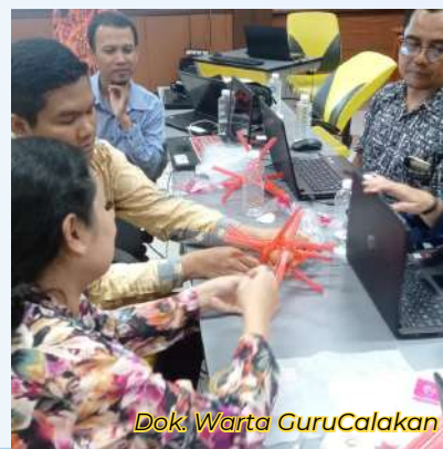
Dok. Warta GuruCalakan

Pada tahap On, peserta harus mengembangkan modul Projek Penguatan Profil Pelajar Pancasila (P5) berbasis STEM yang dilaksanakan pada tahun ajaran 2023-2024 Semester 1. Hasil modul P5 tersebut selanjutnya dilaksanakan reviu pada salah satu sekolah di kabupaten masing-masing, disertai adanya kerjasama dinas terkait. Setelah kegiatan ini, peserta juga mendiseminasikan hasil pembelajaran yang didapat kepada sekolah-sekolah di sekitarnya. Kegiatan ini menghasilkan tersusunnya 73 modul P5 berbasis STEM. Selain itu, semua peserta terlatih dalam mengembangkan modul Proyek Penguatan Profil Pelajar Pancasila (P5) berbasis STEM. ***