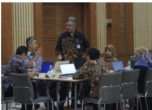
Dok. Warta GuruCalakan

Harapan dari pelaksanaan Diklat Kalibrasi selain memberdayakan komunitas belajar sekolah aktif adalah untuk mewujudkan pembelajaran yang berorientasi pada peserta didik. Melalui serangkaian materi dan aktivitas pelatihan yang menarik guru dilatih agar terampil merencanakan dan melaksanakan pembelajaran yang menyenangkan dan bermakna. Selain itu guru juga dilatih agar terampil mengembangkan perangkat asesmen yang menjadi kunci keberhasilan pembelajaran dalam implementasi Kurikulum Merdeka di kelas. ***JMN