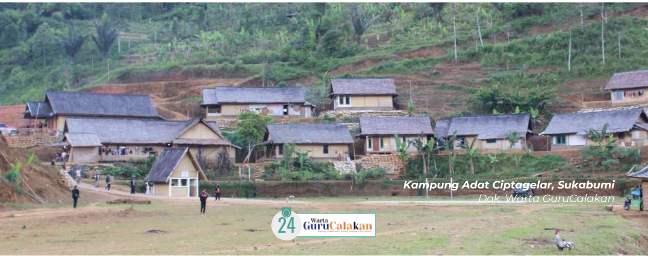
Kampung Adat Ciptagelar, Sukabumi