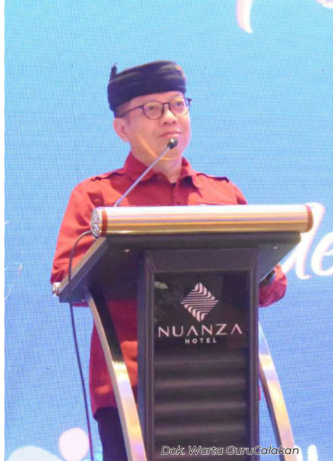
Dok. Warta GuruCalakan

Sambut Hari Guru Nasional 25 November 2023, BBGP Provinsi Jawa Barat mengadakan perhelatan akbar “Semarak Karya Hari Guru Nasional 2023” pada 20-23 November 2023 di Nuanza Hotel & Convention dan Holiday Inn Cikarang Kab. Bekasi dihadiri oleh 524 orang insan pendidikan yang tersebar di Provinsi Jawa Barat dan terdiri dari guru, kepala sekolah, pengawas sekolah, dan komunitas belajar.