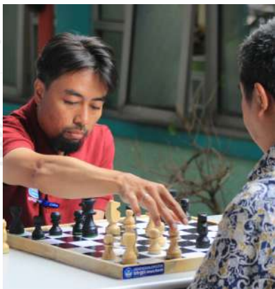
Dok. Warta GuruCalakan

Perayaan hari Kemerdekaan Republik Indonesia ke-78 dilangsungkan dengan meriah di BBGP Jabar. Panitia HUT RI BBGP Jabar tahun 2023 ini mengusung tema yang sama dengan tema nasional yaitu "Terus Melaju untuk Indonesia Maju." Untuk itu didesain perayaan berupa berbagai aktivitas lomba yang bertujuan untuk memperkuat kerja sama tim di internal lembaga BBGP Jabar dalam melaksanakan tugas dan fungsi Lembaga.