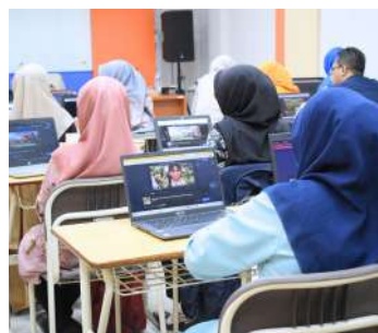
Dok. Warta GuruCalakan

K amis, minggu kedua setiap bulan, menjadi hari yang ditunggu-tunggu. Di saat itu, BBGP Jabar Kampus 2, Jln. Dr.Cipto, Bandung dipenuhi oleh 125 pendidik dan tenaga kependidikan (PTK) terpilih yang antusias mengikuti Gerai Literasi (Garasi) Digital Karetasobat. Kegiatan ini merupakan salah satu andalan BBGP Jabar dalam meningkatkan kompetensi literasi digital para PTK Jawa Barat.