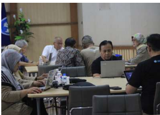
Dok. Warta GuruCalakan