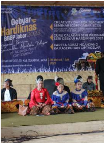
Dok. Warta GuruCalakan