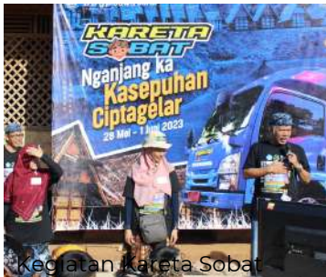
Kegiatan Kareta Sobat

Program Kareta Sobat dipandu oleh narasumber dan fasilitator dari BBGP Jabar. Aktivitas pagi sampai menjelang sore melibatkan anak dalam kegiatannya.