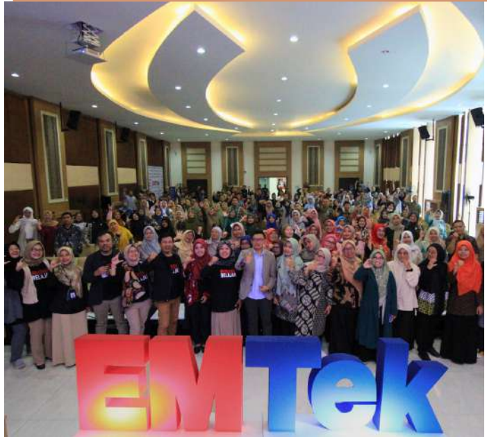
Dok. Warta GuruCalakan