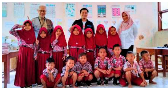
Dok. Warta GuruCalakan

dan bahasa yang memadai untuk berinteraksi sehat dengan teman sebaya dan individu lainnya; 4. pemaknaan terhadap belajar yang positif; 5. pengembangan keterampilan motorik dan perawatan diri yang memadai untuk dapat berpartisipasi di lingkungan sekolah secara mandiri; dan 6. kematangan kognitif yang cukup untuk melakukan kegiatan belajar, seperti dasar literasi, numerasi serta pemahaman tentang hal-hal mendasar yang terjadi dalam kehidupan sehari-hari.