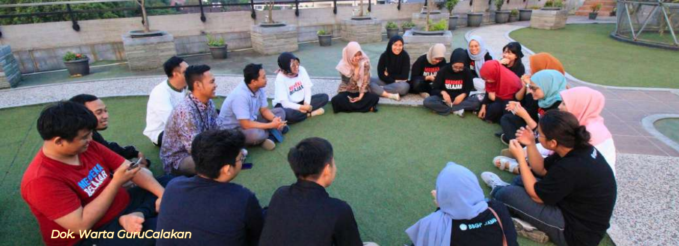
Dok. Warta GuruCalakan

mereka hanya satu bidang keahlian yang berperan. Maka perlu banyak disiplin ilmu untuk melengkapi hal itu. Ini yang sering dilakukan generasi milenial dalam bertindak. Mereka merasa ada tantangan baru untuk eksplorasi, mencari tahu dan tidak cepat puas dengan hasil. Maka mereka sangat berperan dalam merangsang nilai-nilai seperti itu.