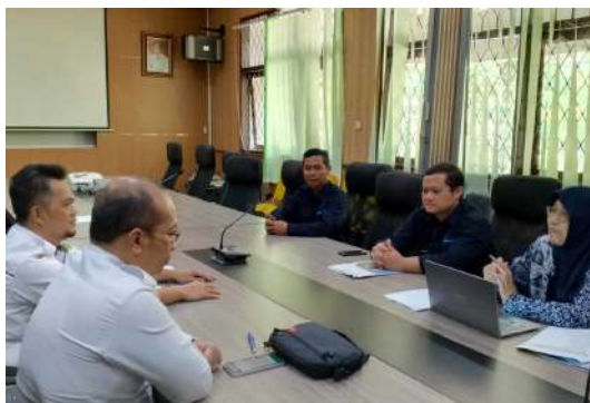
Dok. Warta GuruCalakan

Aplikasi ini disediakan oleh Kementerian Pendidikan, Riset dan Teknologi (Kemendikbudristek). Pada proses penyesuaian ini, pejabat fungsional guru, pengawas sekolah, penilik, dan pamong belajar hanya perlu login kemudian mengunggah pakta integritas di atas materai dan Penetapan Angka Kredit (PAK) Konvensional atau surat HPAK terakhir yang sudah dilegalisir oleh pejabat yang berwenang menetapkan PAK.*** (Aghmn)