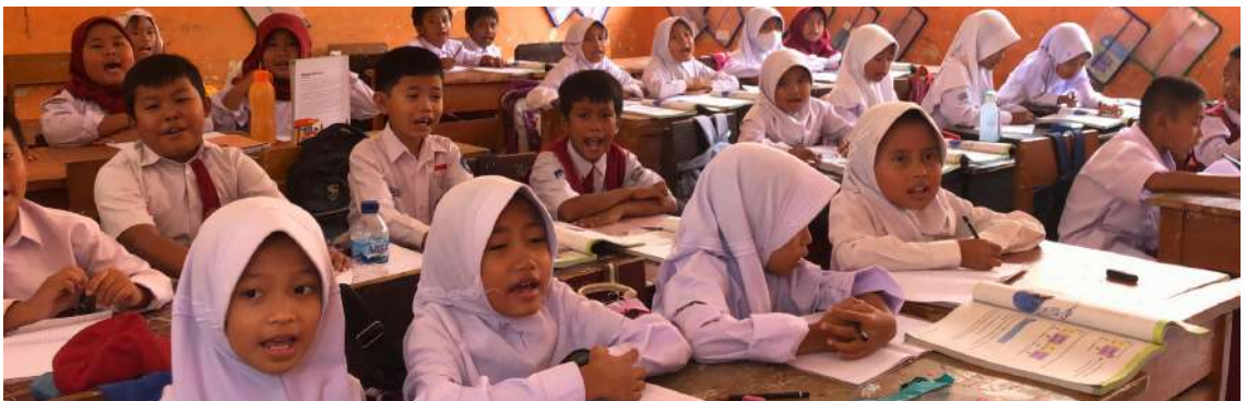
Dok. Warta GuruCalakan

“SEKOLAH PENGGERAK ITU KAN BEDA YA. GURU-GURUNYA SEPERTI DIBAWA BERLARI. TIDAK ADA YANG SANTAI-SANTAI DAN ALHAMDULILLAH SEMUA GURU-GURUNYA KEREN. MAU BELAJAR,”