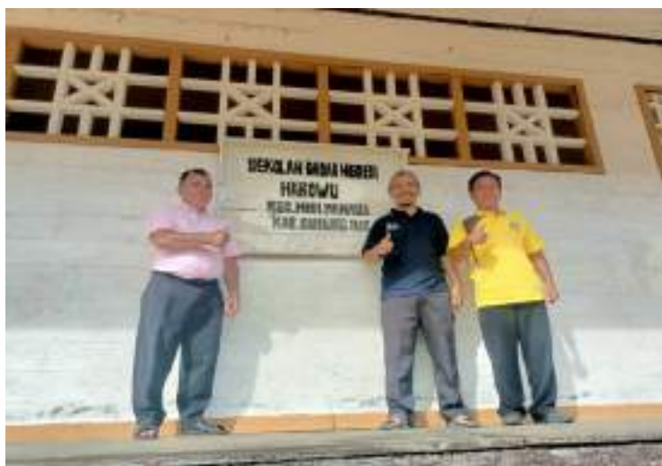
Di SDN Harowu Bersama Kepala Sekolah dan Dinas Pendidikan setempat

Usai melakukan fasilitas individu 2, tim