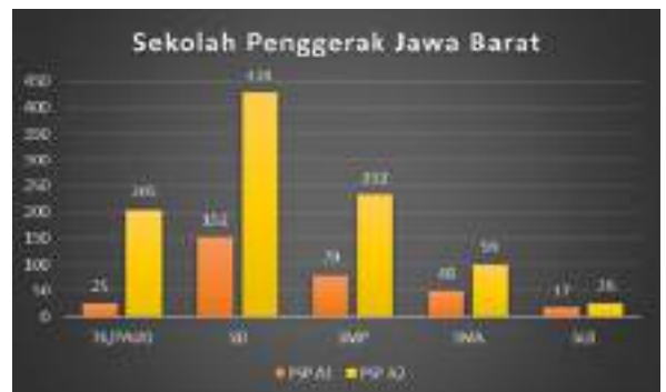
Tabel Partisipasi PSP di Angkatan ke-1 dan ke-2

terintegrasi dengan ekosistem hingga seluruh sekolah di Indonesia menjadi sekolah penggerak. Intervensi dilakukan secara holistik, mulai dari SDM sekolah, pembelajaran, perencanaan, digitalisasi, dan pendampingan Pemerintah Daerah. Pendampingan dilakukan selama 3 tahun ajaran dan sekolah melanjutkan upaya