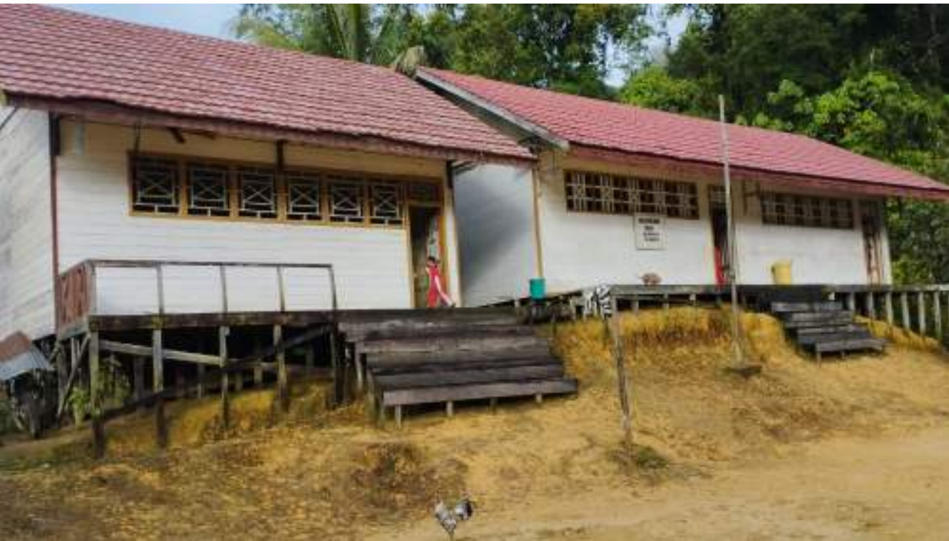
Kondisi SDN Harowu.

Panjang dan letihnya perjalanan, tak terasa lagi ketika beberapa guru dan warga menyambut kami. Untuk tempat beristirahat, kami diarahkan ke rumah dinas guru yang disediakan bagi para guru. Sekolah Dasar Negeri Harowu, merupakan sekolah terujung yang memiliki 4 guru dan 25 siswa dari 6 rombongan belajar.